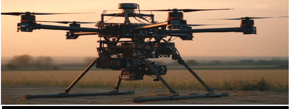
ସୁଦେଶୀ ଡ୍ରୋନ୍ ଡିଲ୍

ନୂଆଦିଲ୍ଲୀ : ବଦଳୁଥିବା ସମୟ ଏବଂ ଆଧୁନିକ ଯୁଦ୍ଧ କୌଶଳକୁ ଦୃଷ୍ଟିରେ ରଖି ଭାରତୀୟ ସଶସ୍ତ୍ର ସେନା ନିଜକୁ ସମ୍ପୂର୍ଣ୍ଣ ରୂପେ ବଦଳାଇବାକୁ ଯାଉଛି । ପ୍ରତିରକ୍ଷା କ୍ଷେତ୍ରରେ ଆତ୍ମନିର୍ଭରଶୀଳତାକୁ ଆହୁରି ମଜବୁତ କରି ଭାରତ ସରକାର ଏକ ଐତିହାସିକ ପଦକ୍ଷେପ ନେଇଛନ୍ତି । ସେନା ପାଇଁ ଦେଶର ଇତିହାସରେ ସବୁଠାରୁ ବଡ଼ ‘ସୁଦେଶୀ ଡ୍ରୋନ୍’ କ୍ରୟ ପ୍ରକ୍ରିୟା ଆରମ୍ଭ ହୋଇଛି । ପ୍ରାୟ ୨ ବିଲିୟନ ଡଲାର ଅର୍ଥାତ୍ ଭାରତୀୟ ମୁଦ୍ରାରେ ପ୍ରାୟ ୨୦,୦୦୦ କୋଟି ଟଙ୍କାର ଏହି ବିଶାଳ ଡିଲ୍ ସମ୍ପୂର୍ଣ୍ଣ ଭାବେ ଭାରତୀୟ କମ୍ପାନୀଗୁଡ଼ିକ ସହିତ କରାଯାଉଛି । ଏହି ମେଗା ଡିଲ୍ ଭାରତୀୟ ସେନାର ଶକ୍ତିକୁ ବହୁଗୁଣିତ କରିବା ସହ ଶତ୍ରୁ ଶିବିରରେ କମ୍ପନ ସୃଷ୍ଟି କରିଛି । ରଏଟର୍ସର ଏକ ରିପୋର୍ଟ ଅନୁଯାୟୀ, ଭାରତୀୟ ସେନାକୁ ସର୍ବଦା ଯୁଦ୍ଧ ଏବଂ ଜରୁରୀକାଳୀନ ପରିସ୍ଥିତି ପାଇଁ ପ୍ରସ୍ତୁତ ରଖିବା ସହ ସାମରିକ ଆଧୁନିକୀକରଣ ଲକ୍ଷ୍ୟରେ ଏହି ଯୌଦ୍ଧ କରାଯାଉଛି । ଏହି ବିଶାଳ କ୍ରୟ ପ୍ରକ୍ରିୟା ପାଇଁ ସରକାର ‘ପାଷ୍ଟ-ଟ୍ରାକ୍ କ୍ରୟ ପ୍ରକ୍ରିୟା’ ଆପଣାଇପାରନ୍ତି । ଅନୁମୋଦିତ ଏହି ଡିଲ୍ ଡିଲ୍ (ଟେଲ) ବା ଡ୍ରୋନ୍ ସିଷ୍ଟମର ଏହି ସମ୍ପୂର୍ଣ୍ଣ ପ୍ରକ୍ରିୟା ୧୮ ରୁ ୨୪ ମାସ ମଧ୍ୟରେ ଶେଷ ହେବାକୁ ଲକ୍ଷ୍ୟ ରଖାଯାଇଛି । ସବୁଠାରୁ ଗୁରୁତ୍ୱପୂର୍ଣ୍ଣ କଥା ହେଉଛି, ଭାରତୀୟ କମ୍ପାନୀଗୁଡ଼ିକ ଚଳିତ ବର୍ଷଠାରୁ ହିଁ ସେନାକୁ ଡ୍ରୋନ୍ ଯୋଗାଇବା ଆରମ୍ଭ କରିଦେବେ ବୋଲି ଆଶା କରାଯାଉଛି । ନିକଟରେ ହୋଇଥିବା ୩,୦୦୦ କୋଟିର ଟାକ୍ଟିକାଲ୍-କ୍ଲ୍ୟୁ ଡ୍ରୋନ୍ ଡିଲ୍ ଡୁଲନାରେ ଏହି ନୂତନ ୨୦,୦୦୦ କୋଟିର ମେଗା ଡିଲ୍ ପ୍ରତିରକ୍ଷା କ୍ଷେତ୍ରରେ ଏକ ବଡ଼ ଗେମ୍-ଚେଞ୍ଜର ସାବ୍ୟସ୍ତ ହେବ । ‘ଅପରେସନ ସିନ୍ଦୂର’ ପରଠାରୁ ହିଁ ପ୍ରତିରକ୍ଷା